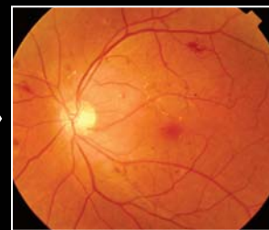
初期の出血(自覚なし)