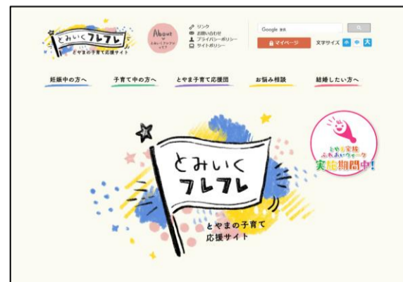
③ 「とみいくフレフレ病児保育施設」