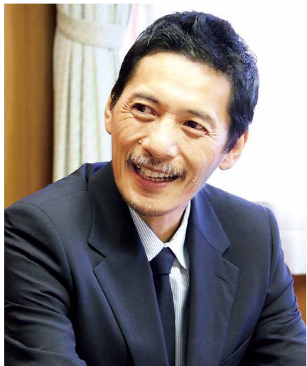
ひらお せいじ 平尾 誠二氏 日本ラグビーフットボール協会理事 ／神戸製鋼ラグビー部ゼネラルマネージャー

すから、逆に、「こっちが困っていたら、」気になさるなよ」という話になってきますしね。