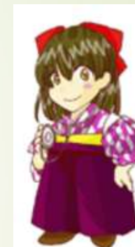
マドンナドクター