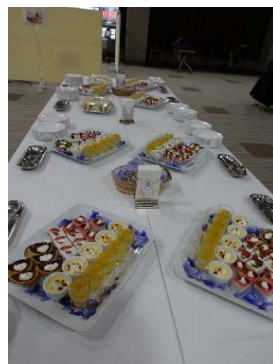
【デザートビュッフェ】