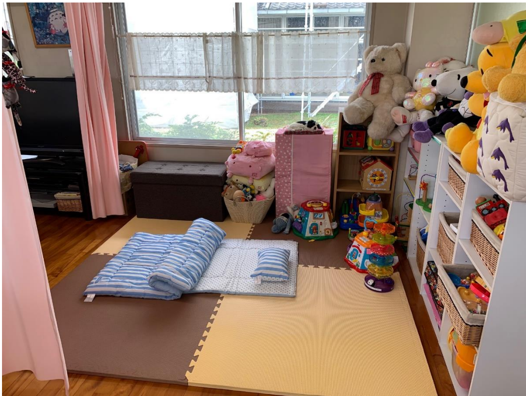
病児保育のお部屋