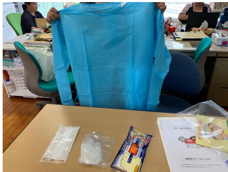
E会員を守るグッズ