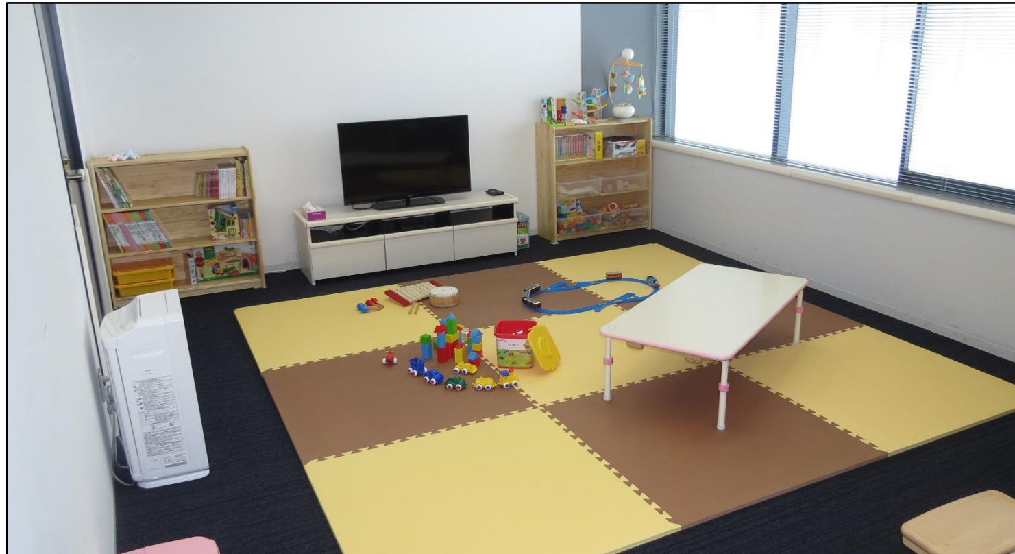
府医キッズルームの様子